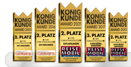
Zahlreiche Auszeichnungen krönen die Qualität unserer Megasat-Produkte

Zugriff auf viele Mediatheken und Videoportale